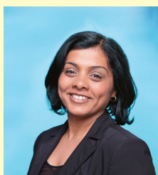
Tanja Jadnanansingh Lid Tweede Kamer (PvdA)

“De 50plusBeurs heeft vanaf het prille begin vruchtbaar contact met Nehob. De beurs brengt mensen samen van alle afkomst en informeert over leven en toekomst. Dat jaarlijks méér Hindoestanen de beurs bezoeken is een bevestiging van succesvol samenwerken. Ik feliciteer NEHOB en haar leden van harte, en wens dat nog generaties lang haar stem wordt gehoord en haar daden worden gevoeld.”