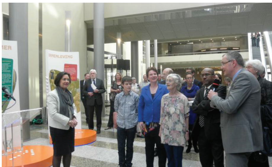
Mw. Gerdi Verbeet, voorzitter van de Tweede Kamer, proclameert het Europese Jaar voor actief ouder worden en solidariteit tussen generaties (2012)